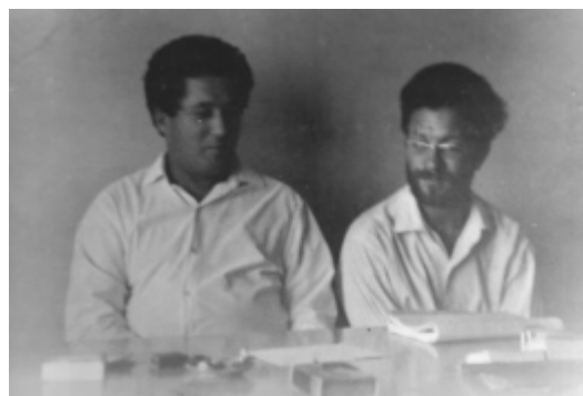
П.И. Якир и Илья Габай. 1968 г.