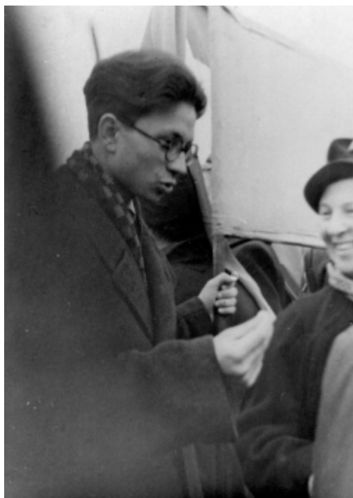
Студент 1-го курса МГПИ.