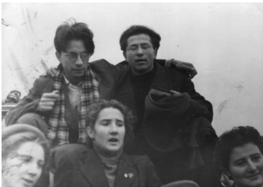
На целинных землях Алтая с сокурсниками дефектологического ф-та МГПИ им. Ленина. Лето 1958 г.