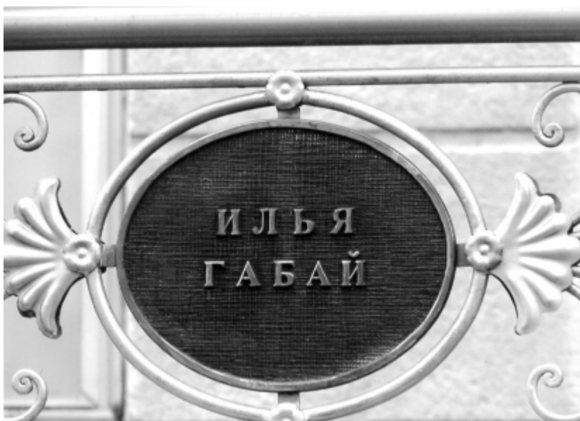
Памятник «Возрождение» на территории Крымского индустриально-педагогического Университета. Фрагмент.