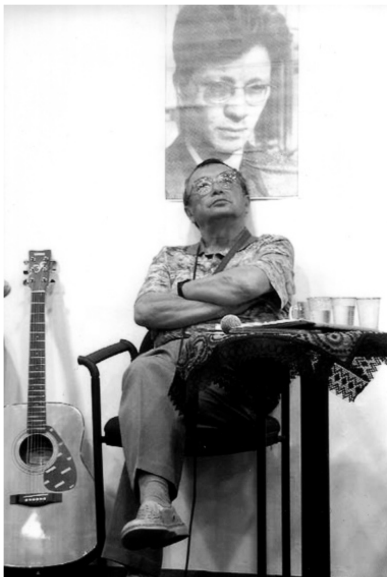
Юлий Ким на вечере памяти Ильи Габая в Иерусалиме.