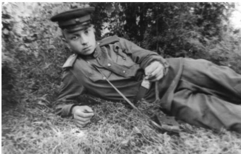
Военный лагерь Самашки. Июнь 1955 г.