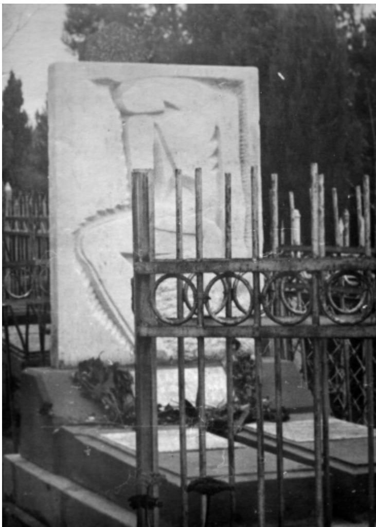
Могила Ильи Габая. Осень 1976 г. Надгробье работы художника В. Сидура