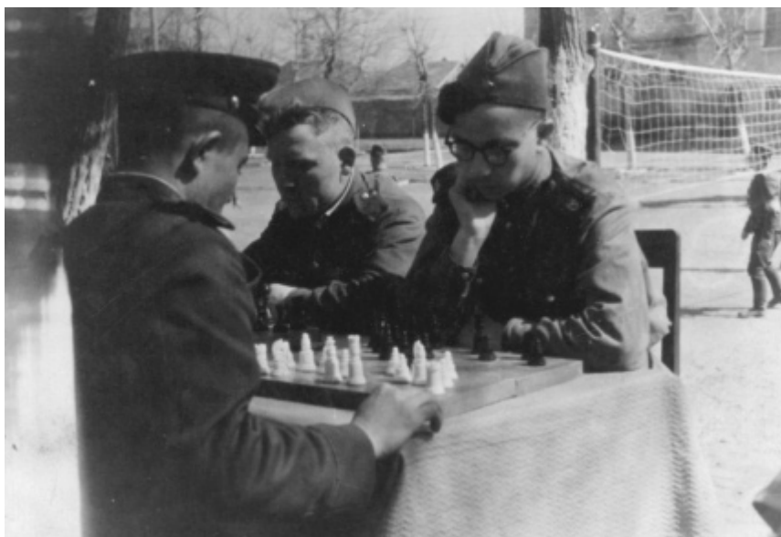
В армии. 1956 г.