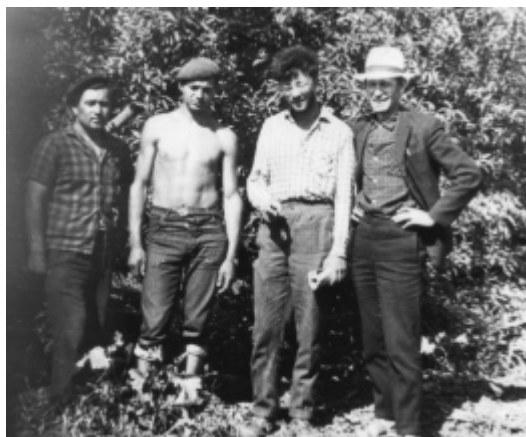
В археологической экспедиции. Гобручи, Молдавия. Май 1968 г.