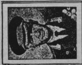
ГЕН. МАЮР Г.ГРИГОРЬЕВО

Каждый человек имеет право на свободу убеждений и на свободное выражение акт это право, включает свободу беспрепятственно принимать религиозные верования и свободу исповедовать их. Распространить свободу мысли, совести, религии, убеждений и независимо от государственной границы. «Всеобщая Декларация Прав Человека», Статал 19.