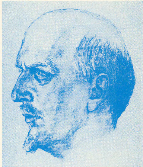
Профессор И. А. ИЛЬИН