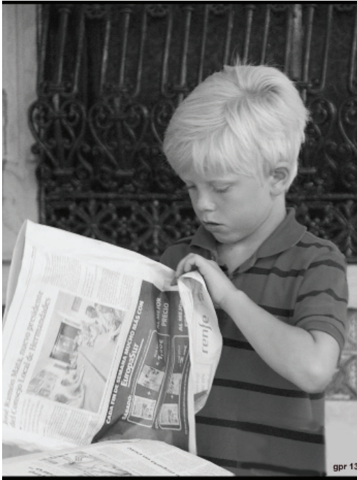
El joven lector de periódicos (2013), de Gerardo Piña-Rosales.