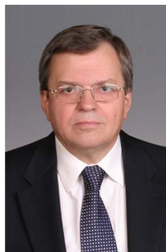
Академик РАН Владислав Яковлевич Панченко ФНИЦ «Кристаллография и фотоника» РАН Троицк, Москва, Россия