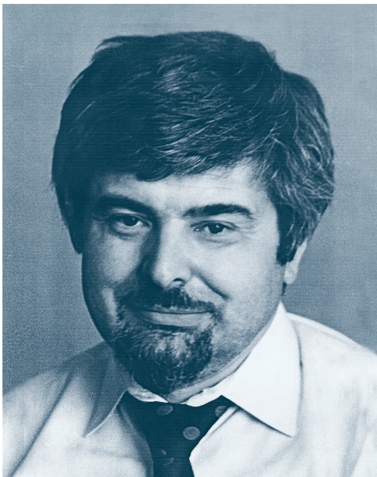
Гавриил Харитонович Попов