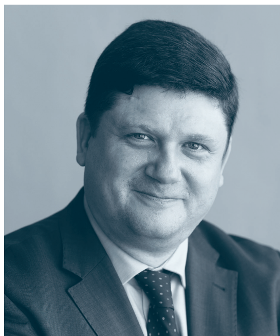
Александр Александрович Широв