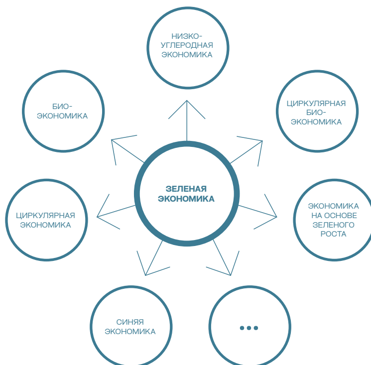
Рис. 2. «Зеленая» экономика и ее типы

Терминологически концепция «зеленой» экономики включила в сферу своего рассмотрения быстро расширяющийся круг коррелирующих экономических вопросов: «зеленые» инвестиции, «зеленую» занятость, «зеленые» финансы, «зеленые» инновации и т. д. И все эти экономические модели не являются теоретическими измышлениями ученых-экономистов — они очень быстро воплощаются в жизнь. Так, Европейское сообщество приняло вполне реалистичные и обоснованные стратегии развития «зеленой», циркулярной и биоэкономики до 2030–2050 годов с конкретными целями, количественными индикаторами и механизмами, направленными на их поддержку.