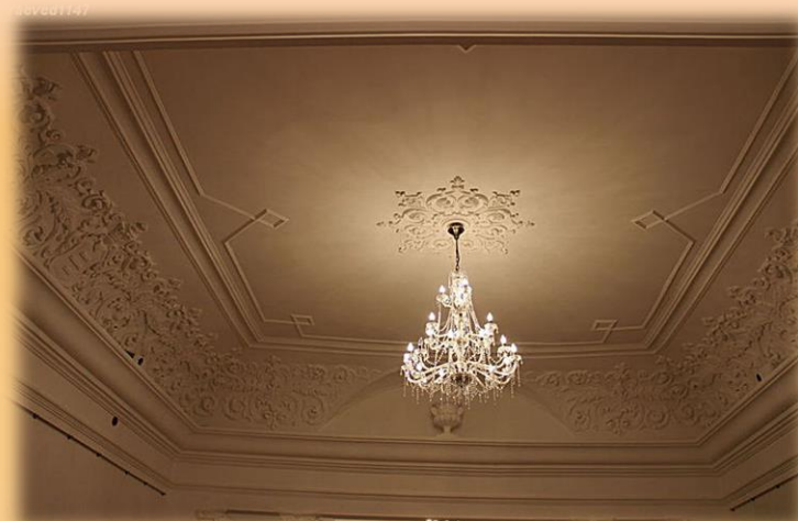
А вот и люстра.