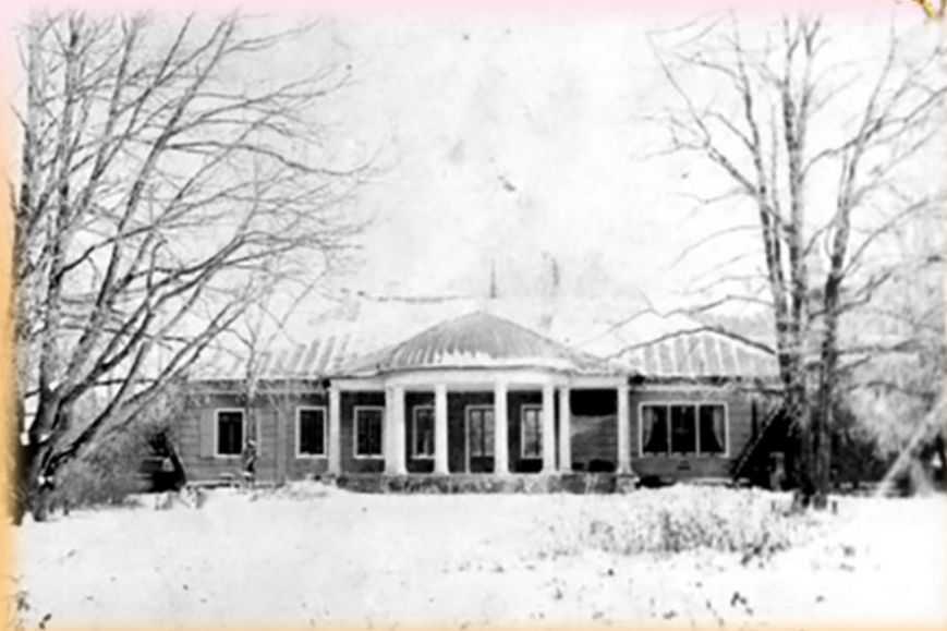
Усадьба Мара в Вяжле