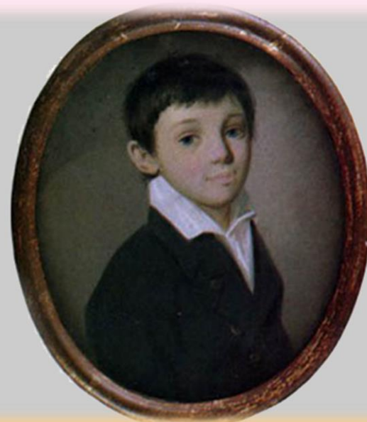
Евгений Баратынский в детстве

Планам не суждено было сбыться. Весной 1814 года за плохое прилежание к учебе юношу оставили на второй год. Компания друзей Евгения посвящала большую часть времени не урокам, а проказам. Самоназванное «Общество мстителей» изводило нелюбимых преподавателей злыми шутками. Забавы закончились плохо - друзья украли у отца одного из мальчишек черепаховую табакерку в золотой оправе вместе с деньгами.