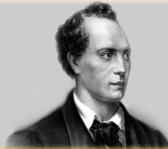
Евгений Баратынский в молодости