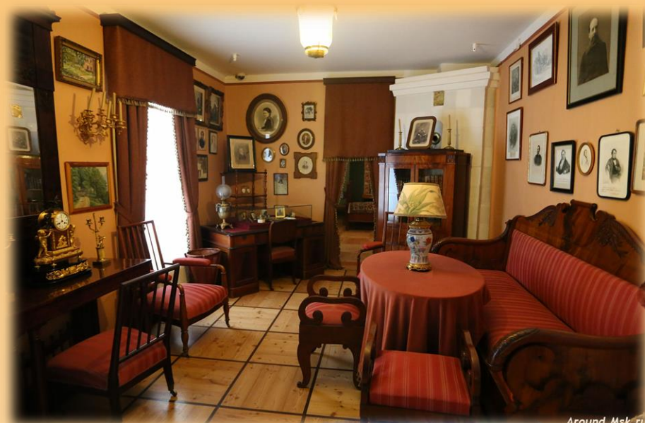
Дом музей Баратынского Мураново