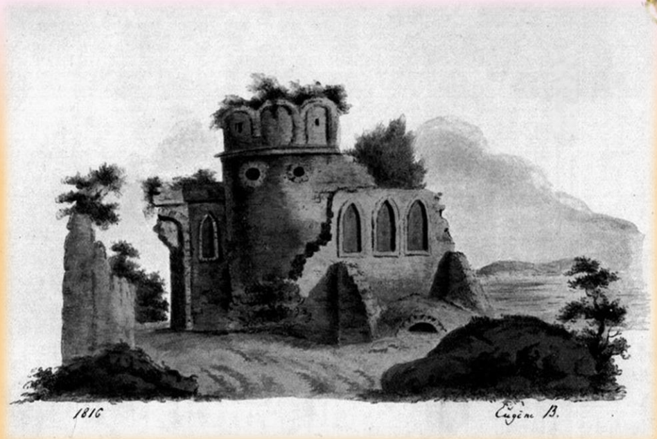
Баратынский замок Боратынь

Поэзию Евгения Баратынского критиковали с разных точек зрения. Декабристы упрекали поэта в отсутствии гражданской позиции и излишнем влиянии классицизма. Романтизма в текстах было многовато для критиков, но мало завсегда для литературных гостиных. Сам автор к концу жизни редактировал свои ранние вещи, убирая из них лиричность и накатанность стиля, что также не нашло понимания у поклонников таланта.