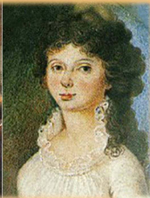
Родители Евгения Баратынского