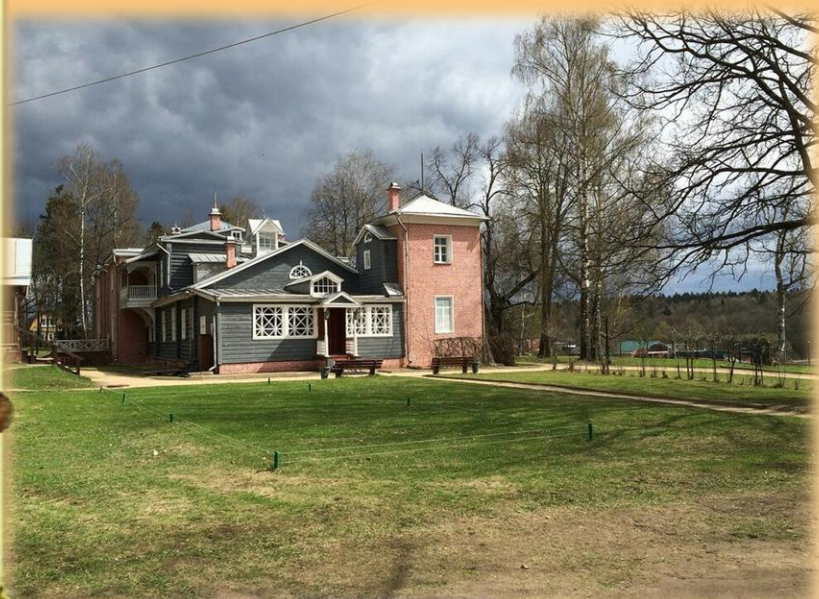
Поместье Мураново Баратынских