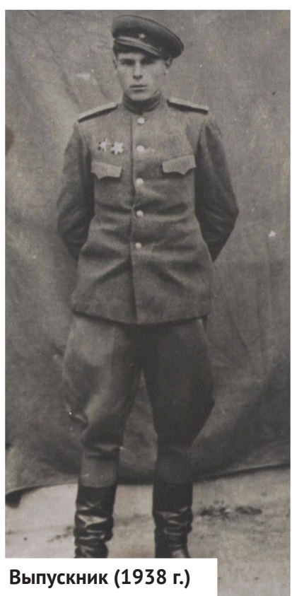
Выпускник (1938 г.)