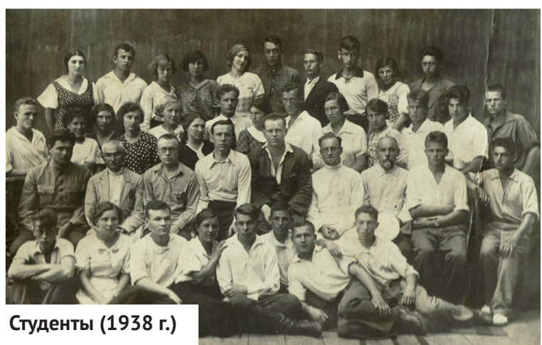
Студенты (1938 г.)