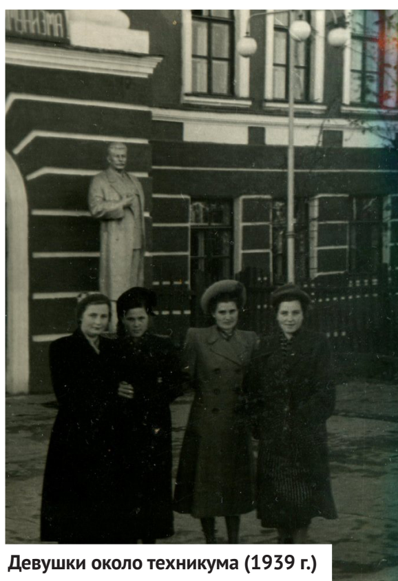
Девушки около техникума (1939 г.)