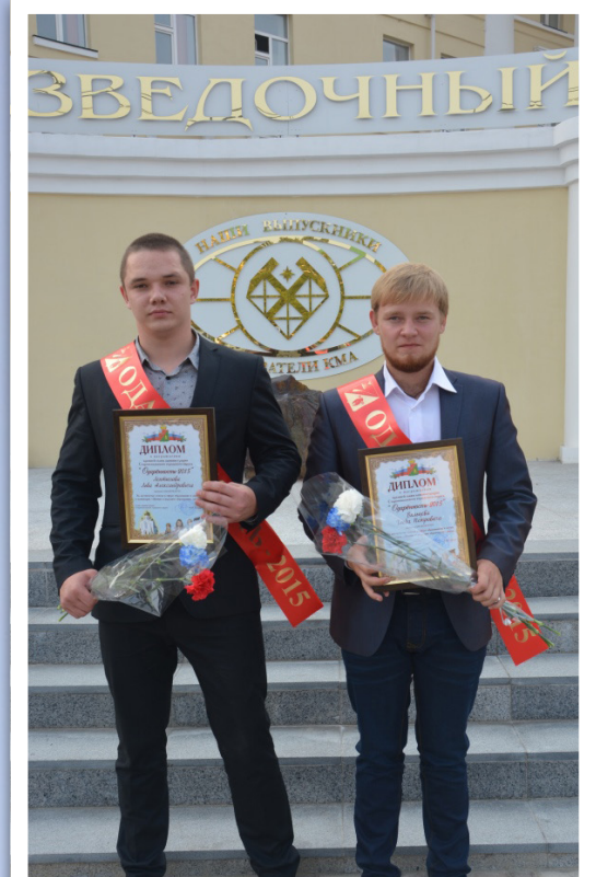
Выпускники с дипломами (2015 г.)