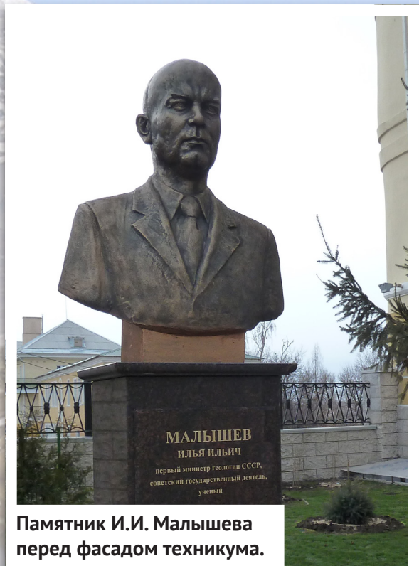
Памятник И.И. Малышева перед фасадом техникума.