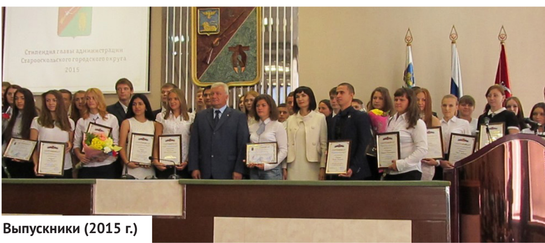
Выпускники (2015 г.)