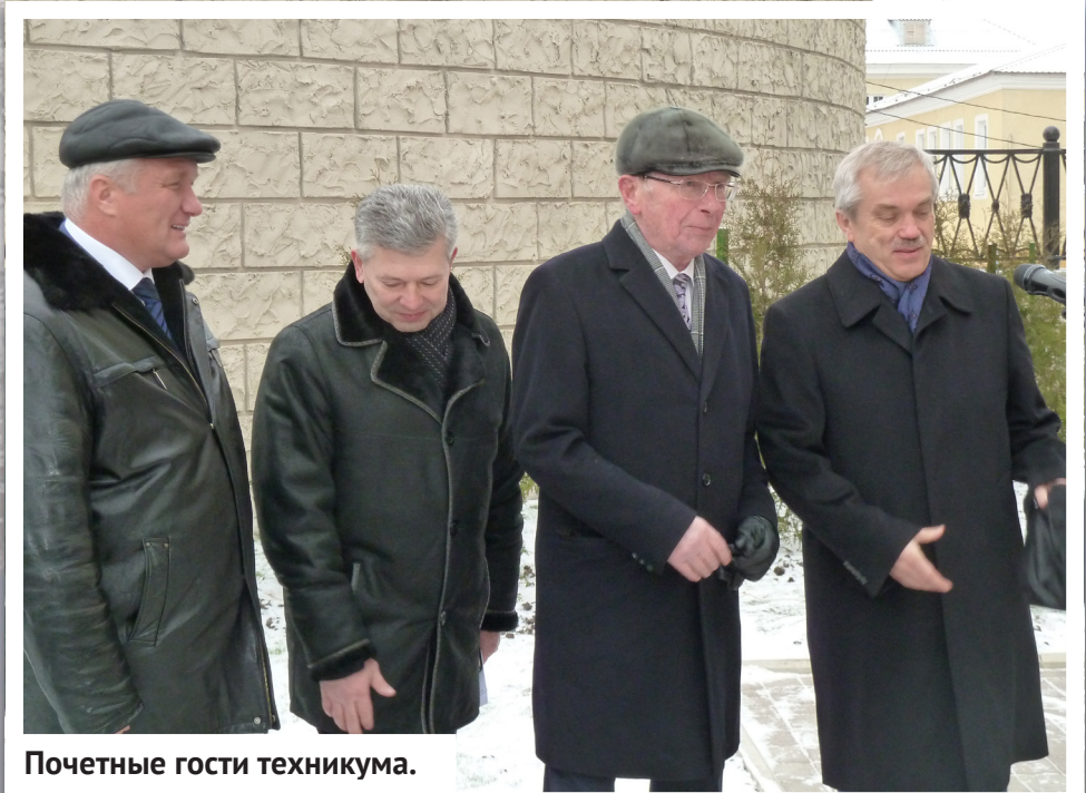
Почетные гости техникума.