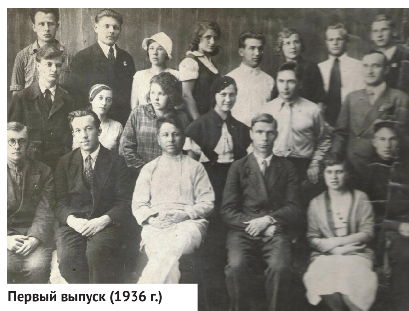
Первый выпуск (1936 г.)