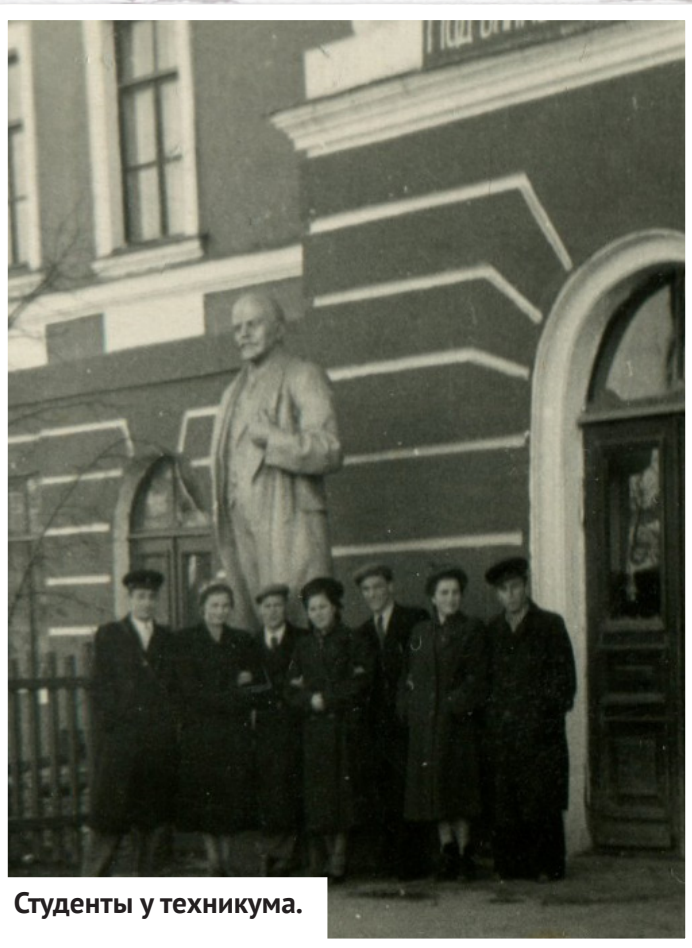
Студенты у техникума.