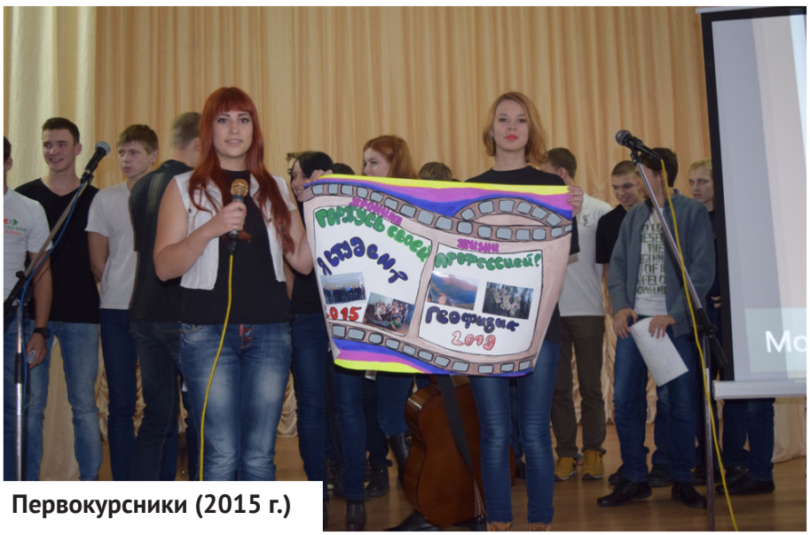
Первокурсники (2015 г.)