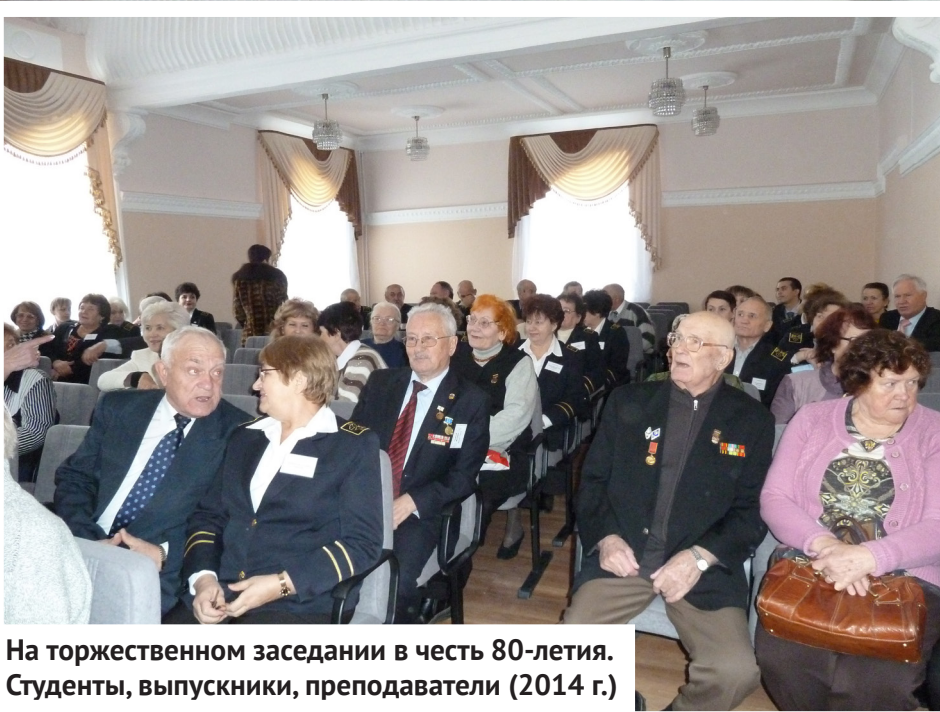
На торжественном заседании в честь 80-летия. Студенты, выпускники, преподаватели (2014 г.)