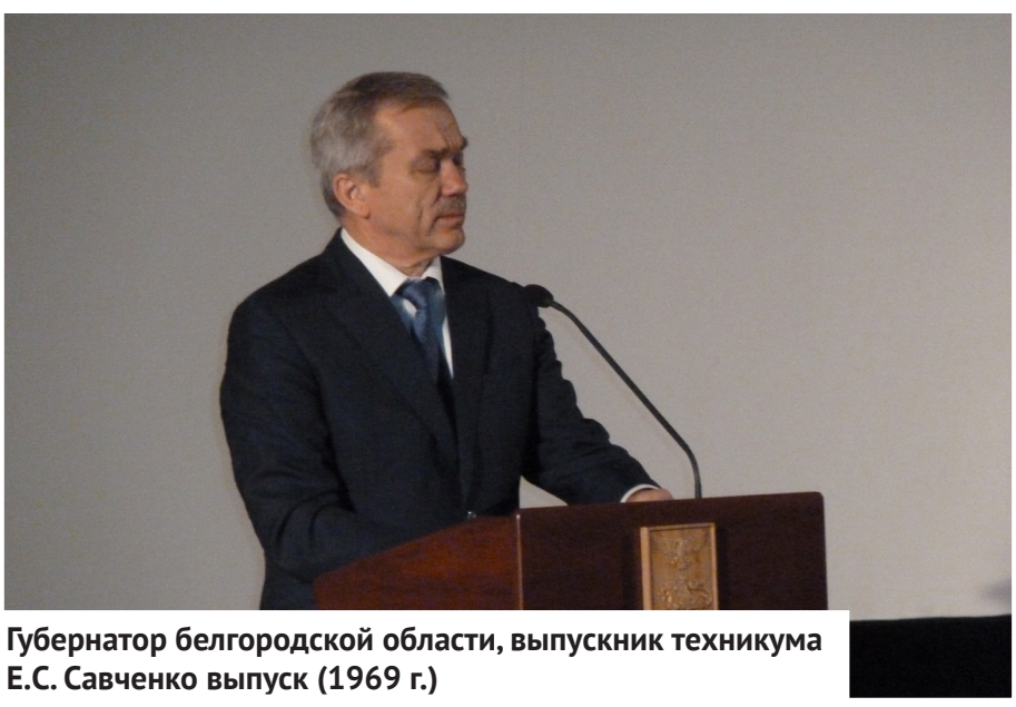
Губернатор белгородской области, выпускник техникума Е.С. Савченко выпуск (1969 г.)