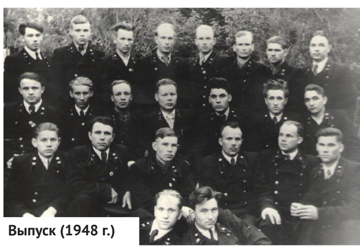
Выпуск (1948 г.)