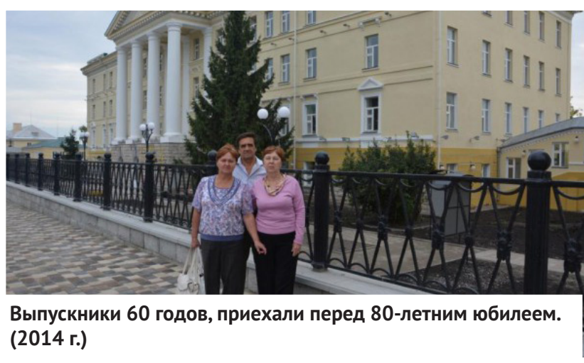
Выпускники 60 годов, приехали перед 80-летним юбилеем. (2014 г.)