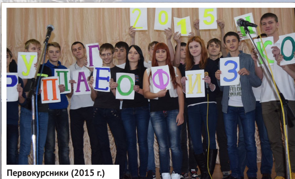
Первокурсники (2015 г.)