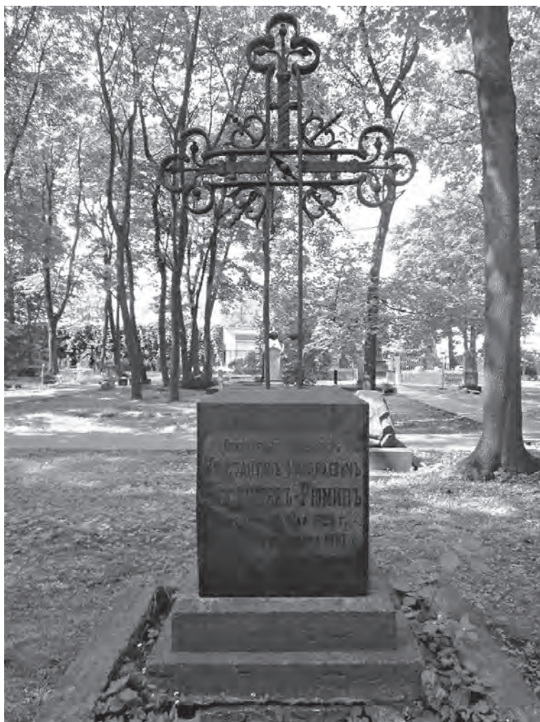
Могила К.Н. Бестужева-Рюмина на Новодевичьем кладбище. Санкт-Петербург