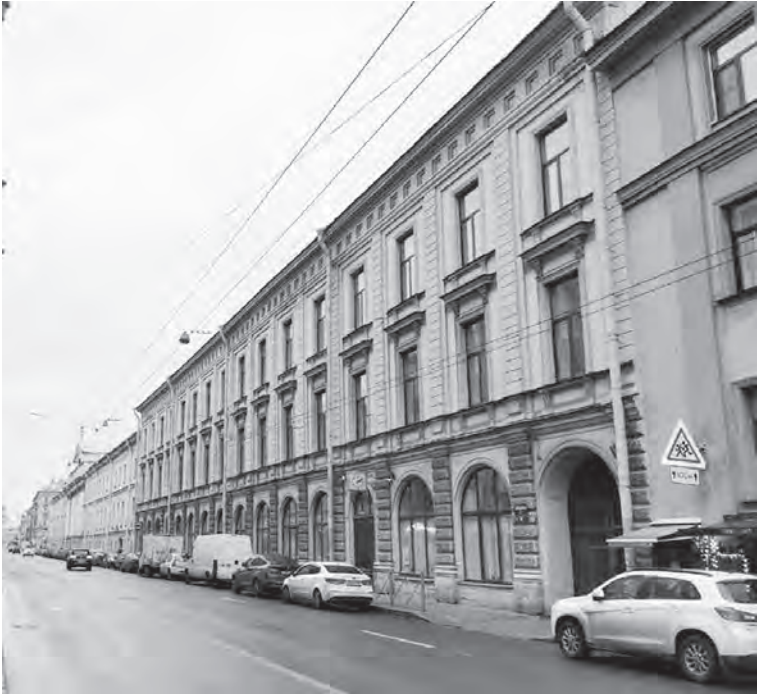
Санкт-Петербург, ул. Гороховая, д. 20. Здание Александровской женской гимназии. В ней первые годы располагались Высшие женские курсы, директором которых в 1878–1882 гг. был К.Н. Бестужев-Рюмин