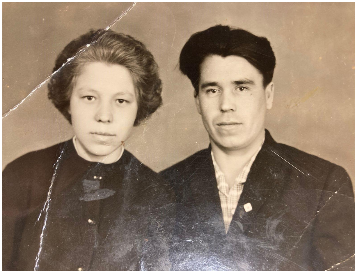
Зәйтүнә апа ире белән