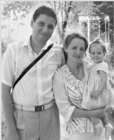
Любимые – сын, сноха, внучка.

И вообще я считаю, что счастье для женщины заключается в любви. Когда есть кому дарить свою любовь, заботу и в ответ от близких людей получать то же самое. Когда рядом: любимый муж – опора и защита; любимые дети и внуки – надежное и спокойное будущее. Когда все они здоровы и благополучны. Когда есть любимая работа, сплоченный дружный коллектив, который за многие годы совместного труда стал второй семьей. У меня все это есть и поэтому я себя считаю счастливым человеком.