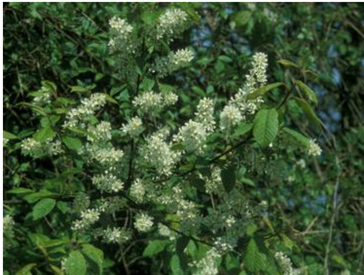
Abb. 5: Vollblüte befallfreier Traubenkirschen

hat möglicherweise auch dazu geführt, dass die Traubenkirsche fast immer ein Baum der 2. Schicht im Auwald bleibt und nicht zu den Hauptarten des Kronenschlusses gehört. Denn einzeln im Freien oder in Stadtgärten aufwachsende Traubenkirschen entwickeln sich weitaus besser als solche im Verbund des Baumbestandes der Auenwälder.