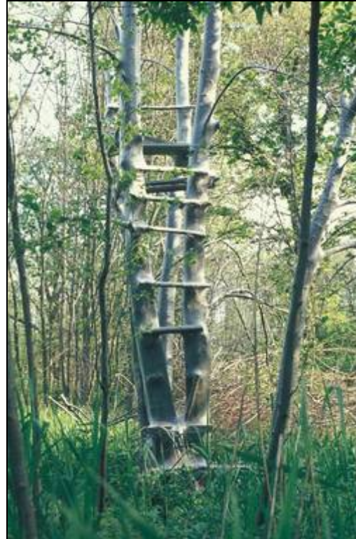
Abb. 4: Eingesponnener Hochsitz

Als Fressfeind kommt allenfalls der Kuckuck in Frage, vielleicht auch der Pirol. Erkennbare Raupenverluste gibt es dadurch nicht. Diese treten erst auf, wenn Schlupfwespen und Raupenfliegen in die Gespinste eindringen und die Raupen, später auch die eingesponnenen Puppen parasitieren. Peter HARTMANN hat dies 1990 in seiner Diplomarbeit an der Ludwig-Maximilians-Universität München unter meiner Anleitung und Betreuung für die Verhältnisse im Jahr 1989 im Auwald am Lech bei Gersthofen näher untersucht. Eigene Untersuchungen ergaben insbesondere bei Massenbefall einen überraschend geringen Parasitierungsgrad von weniger als 5 Prozent. Hauptgrund ist, dass dann die Raupen ihre Puppengespinste in so dichten Massen bilden, das höchstens oberflächlich eine Parasitierung möglich ist. In diesem Zustand haben die Raupen den Baum, auf dem sie leben, praktisch