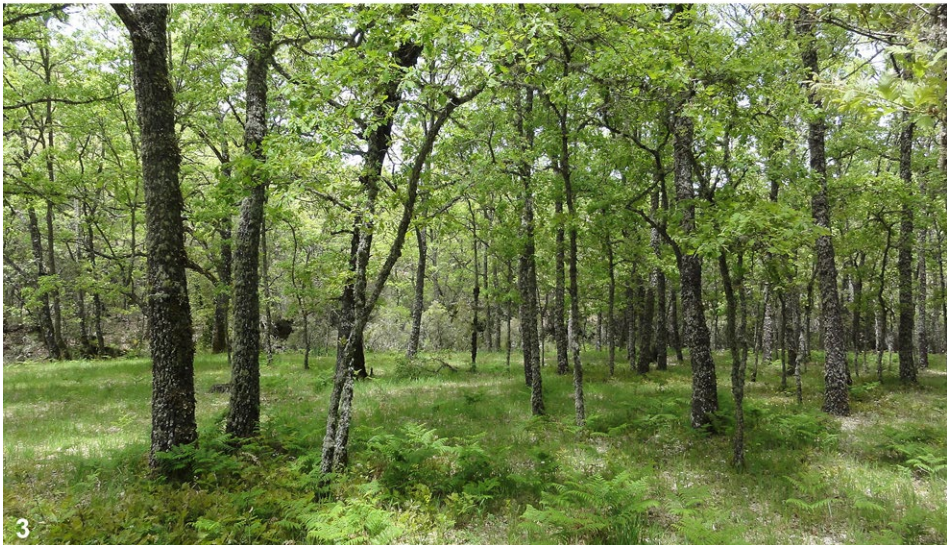
Abb. 2–3: (2) Ciudad Real 1, östlich Saceruela, Sierra de los Canalizos, 700 m SH; (3) Toledo 1, Los Navalucillos, Rio Frio, 650 m SH.