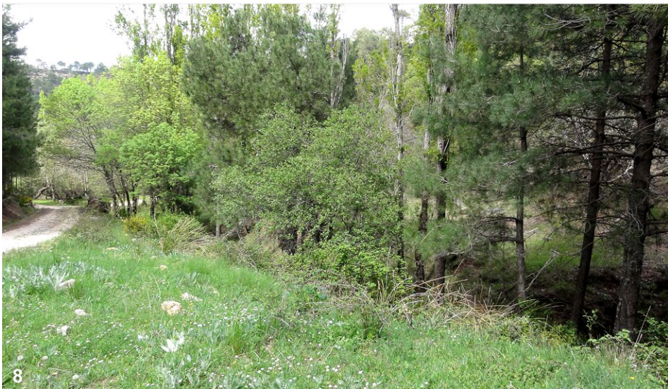
Abb. 7–8: (7) Jaen 1, Sierra de Andujar, Rio Cascajoso, La Aliseda („area recreativa“), 560 m SH; (8) Albacete 1, Sierra de Alcaraz, Bienservida/La Sierra, Fuente la Pileta, 1230 m SH.