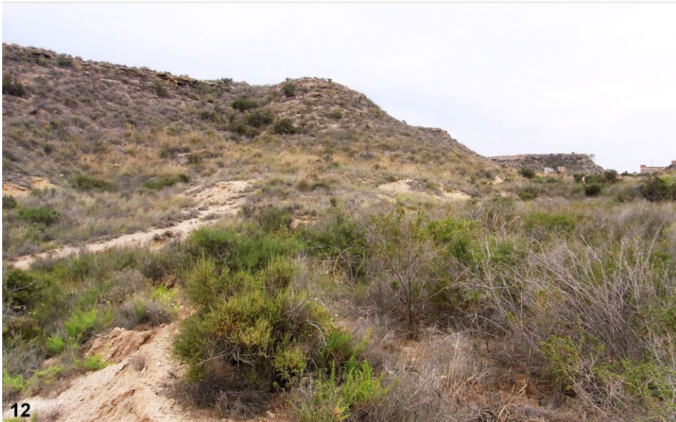
Abb. 11–12: (11) Guadalajara 3, Somolinos, Nace de Rio Bornova, Manadero, 1300 m SH. (12) Murcia 3, Aguilas, 5 m SH.