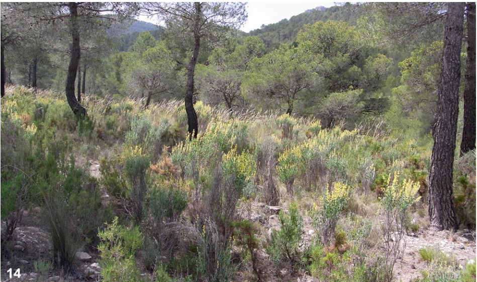
Abb. 13–14: (13) Alicante 1, Jijona, Puerto de la Carrasqueta, Puntal de los Quemados, 1025 m SH. (14) Alicante 2, Petrer, Sierra del Catí, Collado del Portell, 1060 m SH.

Abb. 15–19: (15) Charissa assoi von Granada, Cortijo Tovilla, südlich von Santiago de la Espada, 1400 m SH, 6. 7. 2000, am Licht, leg. & coll. N. Pöll. (16) Nychiodes andalusaria von Guadalajara 4, Cantalojas, am Rio Sonsaz, 1500 m SH, leg. E. Aistleitner, coll. N. Pöll. (17) Charissa assoi , Genital des Weibchens, Präp.-Nr. 124/N. Pöll, det. N. Pöll, conf. S. Erlacher (Chemnitz). (18) Nychiodes andalusaria , Genital des Männchens, Präp.-Nr. 1143/N. Pöll, det. N. Pöll. (19) Detailaufnahme des Aedeagus desselben Präparats.