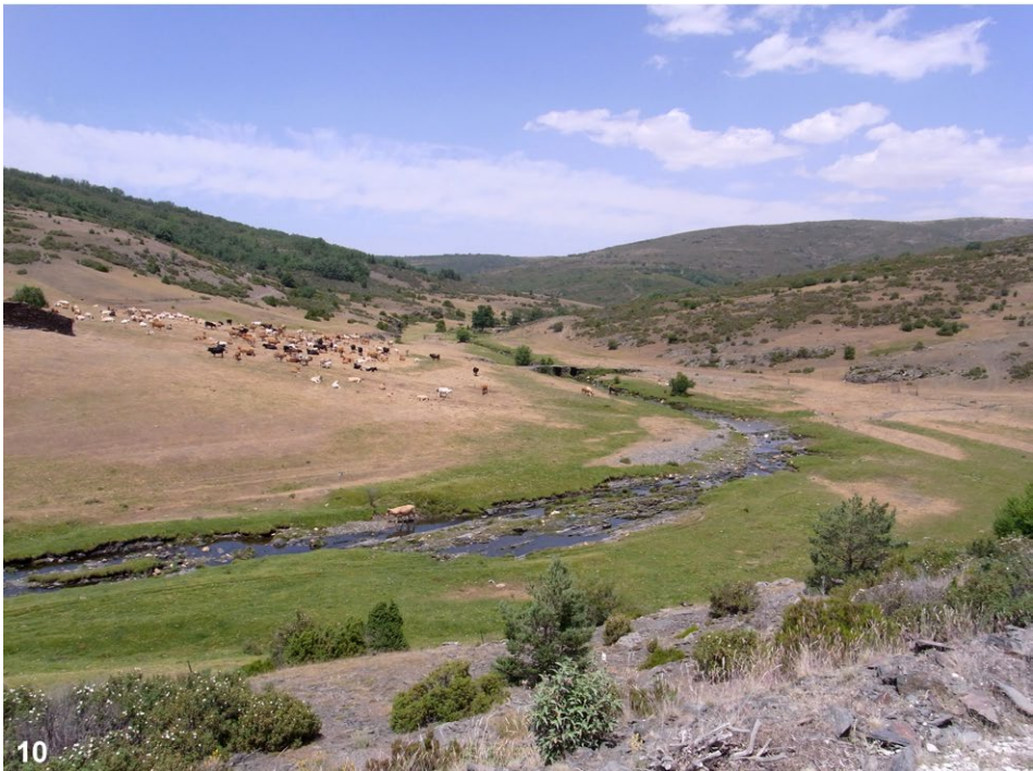
Abb.9–10: (9) Albacete 4, Sierra de Alcaraz, Peñascosa, Arroyo de las Vegas, 1450 m SH; (10) Guadajajara 1, Sierra de Ayllon, 8 km westlich Cantalojas, am Rio Lillas, 1400 m SH.