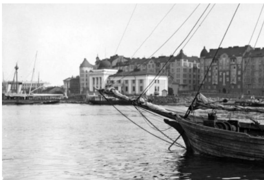
Вид на здание Морского офицерского собрания (на первом плане в центре) со стороны Финского залива. Хельсинки, 1920-е годы 10