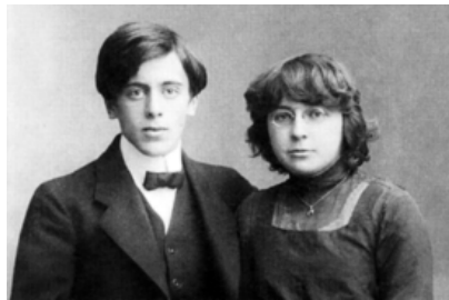
Марина Цветаева с Сергеем Эфроном в 1912 году

Внимательное изучение всех четырёх найденных мною фотоснимков вызвало у меня предположение, что запечатлённая на них молодая дама с короткой стрижкой является Мариной Ивановной Цветаевой. Чтобы проверить эту гипотезу, я провела исследование по идентификации личности молодой незнакомки на фотографиях в Гельсингфорсе. Об этом подробно расскажу ниже, а здесь замечу, что, благодаря тому, что найденные мною групповые фотопортреты сделаны профессиональным фотографом и более 100 лет хранились в альбоме, их качество и сохранность очень высокие. Но чтобы оптимизировать чёткость и яркость изображения, убрать вызванные временем желтизну и мелкие дефекты, после сканирования оригиналов этих фотографий я отреставрировала на компьютере их цифровые копии, что делаю со всеми старыми фотоснимками из семейного архива моей семьи. При этом в этой работе, как и всегда, лица на цифровых копиях фотоснимков не ретушировались.