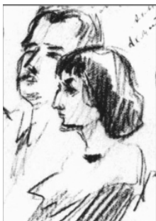
Лозинский и Ахматова на заседании Цеха поэтов». Фрагмент рисунка С.М. Городецкого. 1913 год [23]