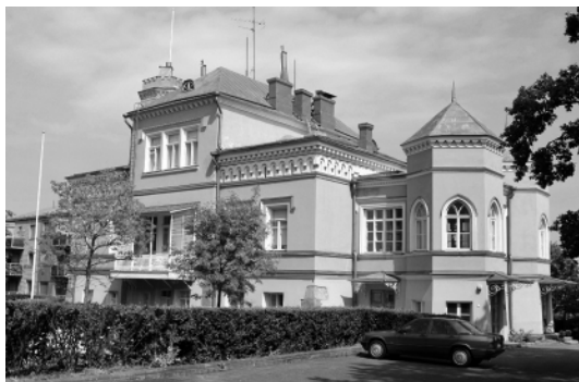
Вилла Каллиолинна в Хельсинки в наши дни.

доктора Ф. Дж. Раббе, интенданта основанного в 1834 году на этой территории парка-курорта с минеральными водами Брункспарк. Здание прекрасно сохранилось до наших дней и сейчас разделено на 4 квартиры, принадлежащие разным владельцам. В 1908–1914 гг. особняк Каллиолинна, принадле-