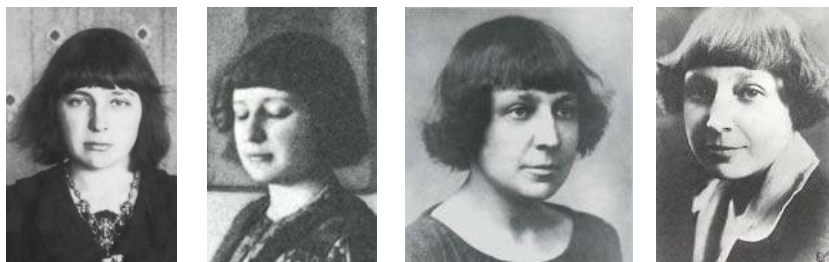
Фотографии М.И. Цветаевой разных лет

Для идентификации личности по фотографии традиционно используется метод наложения друг на друга (на просвет) двух — исследуемого и эталонного — одноракурсных и одномасштабных фотоизображений. Если на этих фотоснимках запечатлено одно и то же лицо, изображения по основным признакам совпадут. На практике применение этого метода, как правило, осуществляется вручную в несколько этапов, с помощью простейших измерительных и оптических приспособлений, что нередко приводит к низкой достоверности результата такого анализа. В этой работе для идентификации личности также был применен этот метод, но масштабирование фотоизображений и их наложение «на просвет» осуществлялось с точностью \pm 0,5 миллиметра на компьютере с помощью профессионального программного обеспечения (ПО) CorelDRAW-12.