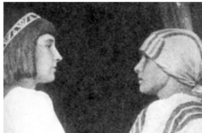
Марина Цветаева с М.П. Кювилье (Кудашевой) в Коктебеле в 1913 году

Известно, что основные признаки элементов внешности, такие как рост, особые приметы, величина и форма черепа, глаз, носа, рта, скул, подбородка и расстояния между ними, у каждого человека, кроме близнецов, уникальны и до старости остаются неизменными; особенно это касается элементов с костно-хрящевой основой [12]. Этот факт широко используется для установления личности, в частности, для оценки тождества лица, изображённого на сравниваемых фотоснимках, то есть для идентификации личности по фотографии. Достоверность идентификации личности оценивается, с учётом идентификационной значимости признака, степенью совпадения совокупности сравниваемых признаков с эталонами, коими могут служить описание внешнего облика