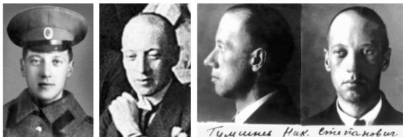
Фотографии Н.С. Гумилёва разных лет