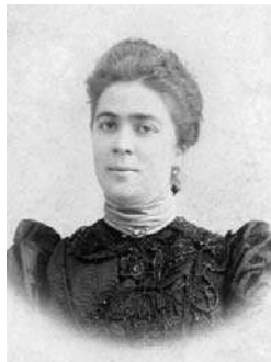
Вице-адмирал Е.К. Небольсин в ранге контр- адмирала в 1910 году и его супруга А.П. Небольсина в начале 1900-х годов. Публикуются впервые

Столбовые дворяне Небольсины на протяжении пяти веков, начиная с великого князя Ивана III, занимая высокие военные и политические посты в Российском государстве, оставили заметный след в русской истории [6]. В частности, древняя Калужская (Брянская) родовая ветвь Небольсиных дала династию из четырёх поколений потомственных офицеров высших рангов Российского Императорского флота. Одним из них был вице-адмирал Евгений Константинович Небольсин (28.01.1859–18.01.1920). Потомственный моряк Е.К. Небольсин был правнуком капитан-командора флота Павла Александровича (1761–1829) [7], внуком капитана 1 ранга Василия Павловича (1794–1847) [8], сыном генерал-лейтенанта по Адмиралтейству Константина Васильевича (1825–1895) [9], братом капитана 1 ранга Вячеслава Константиновича (1870–1933) и контр-адмирала Аркадия Константиновича (1865–1917) Небольсиных [10].