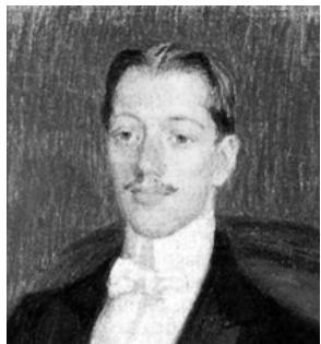
Фрагмент портрета Н.С. Гумилёва 1908 года в Париже кисти В. Фармаковского