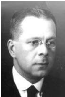
Фотопортреты М.Л. Лозинского разных лет