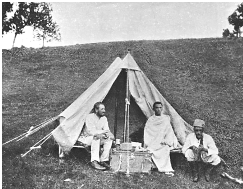
Н.С. Гумилёв (слева) в абиссинской экспедиции. На левой его руке видны наручные часы. Абиссиния. 1913 год 3

На втором групповом фотопортрете у лестницы есть возможность рассмотреть этого незнакомца поближе. Видно, что он явно высокого роста — ведь чтобы войти в кадр снимка, не заслоняя собой остальных, он был вынужден встать позади всех фотографирующихся. Также хорошо виден его удлинённый череп, крупный нос и гладкая причёска «а-ля Капуль» с пробором. Важная деталь: на запястье левой руки этого фронта красуются в то время бывшие большой редкостью большие наручные (не карманные!) часы.