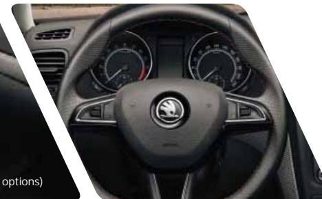
Volant multifonctions Sport 3 branches à méplat