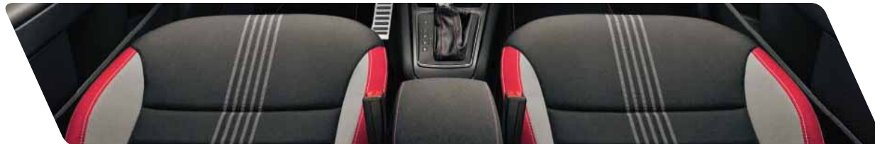
Tissu Monte-Carlo DR