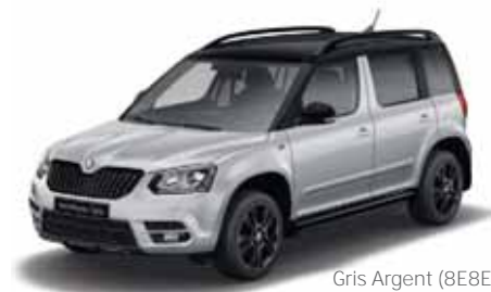
Gris Argent (8E8E)