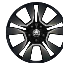
Jantes alliage 17" Origami Noir