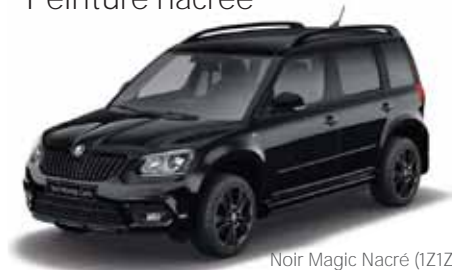
Noir Magic Nacré (I2I2)