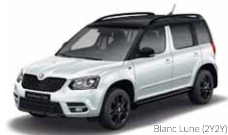
Blanc Lune (2Y2Y)