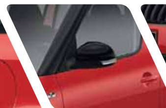
Rétroviseurs extérieurs couleur Noir