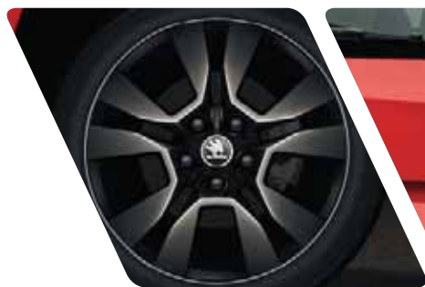
Jantes alliage 17" "Origami Noir"