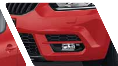
Phares avant antibrouillard