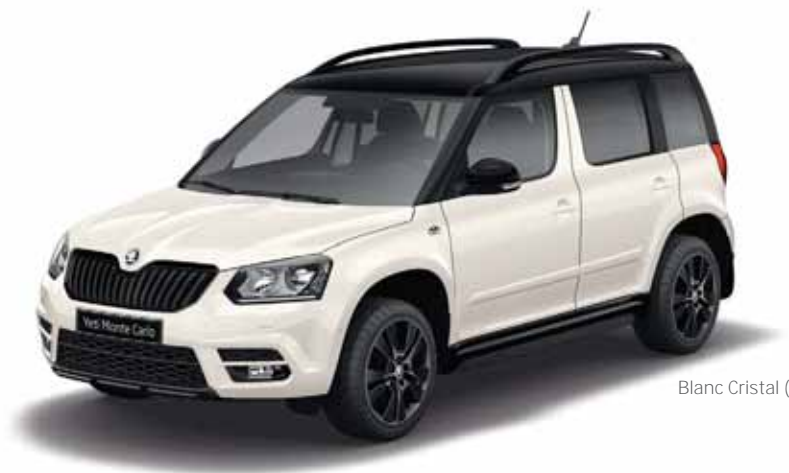
Blanc Cristal (9P9P)