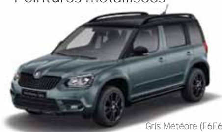
Gris Météore (F6F6)