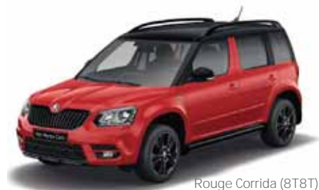
Rouge Corrida (8T8T)