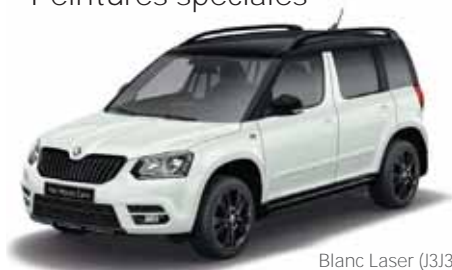
Blanc Laser (J3J3)