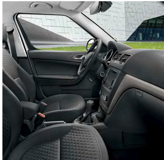
Sellerie spécifique noire tissu "Drive".