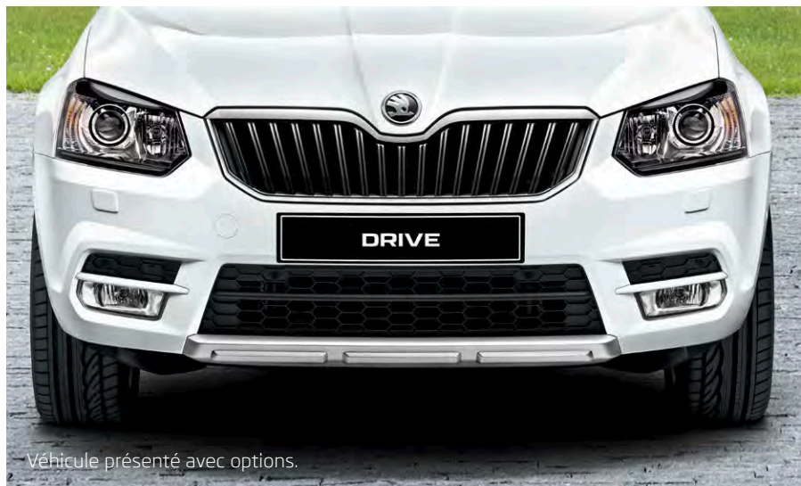
Véhicule présenté avec options.