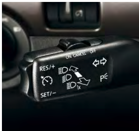
Régulateur de vitesse de série