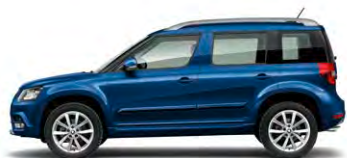
Bleu Tempête (8D8D)