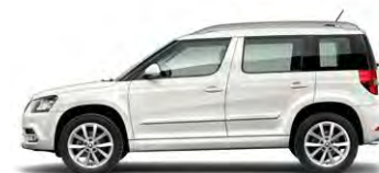
Blanc Pur (0Q0Q)