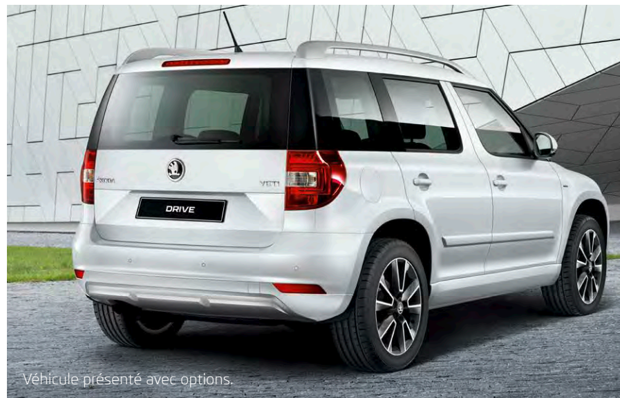
Véhicule présenté avec options.