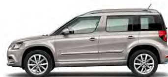
Beige Cappuccino (4K4K)