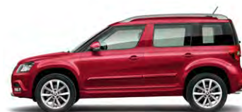
Rouge Rubis (7H7H)