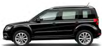
Noir Intense (2T2T)