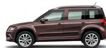
Marron Topaze (4L4L)