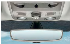
Pack visibilité (détecteur de pluie et de luminosité, rétroviseur intérieur électrochrome).