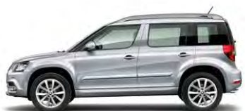
Gris Argent (8E8E)