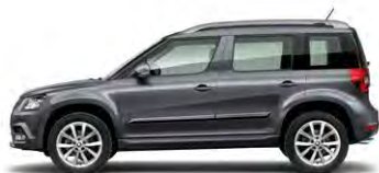
Gris Anthracite (2R2R)