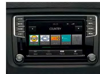
Radio Bolero, écran tactile et lecteur de carte SD, commande vocale couplée à la fonction Smartlink (incl Mirror Link 1.1 / Android Auto / Apple Carplay)