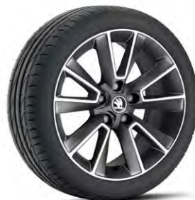
Jantes alliage 17" "Matterhorn".