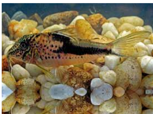
Corydoras fowleri "shirui"