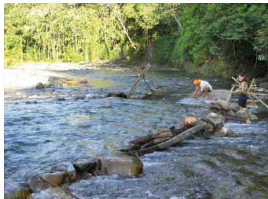
Río Parotori, Alto Urubamba, Cusco