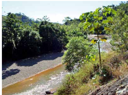
Río Loromayo, tributario del Inambari, Madre de Dios