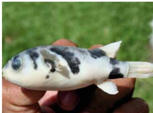
Colomesus asellus "pez globito"