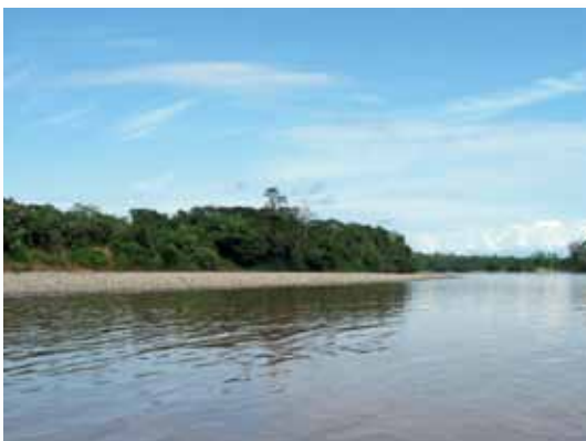
Río Palcazú, Constitución, Pasco