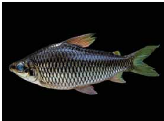
Cyphocharax derhami "chio-chio"