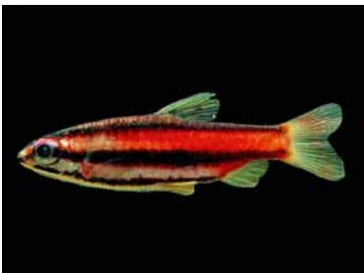
Nannostomus mortenthaleri "pez lápiz"