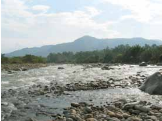
Río Satipo, Junín