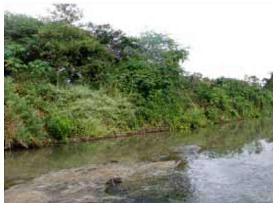
Río Tumbes, Uña de Gato, Tumbes