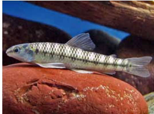
Characidium etheostoma "mojarrita"