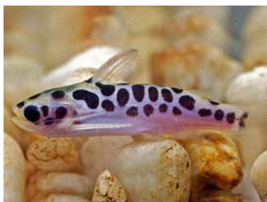
Centromochlus perugiae "aceitero"