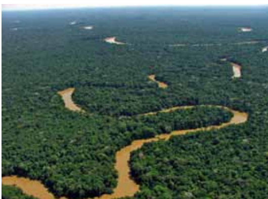
Río Alto Mazán, Loreto