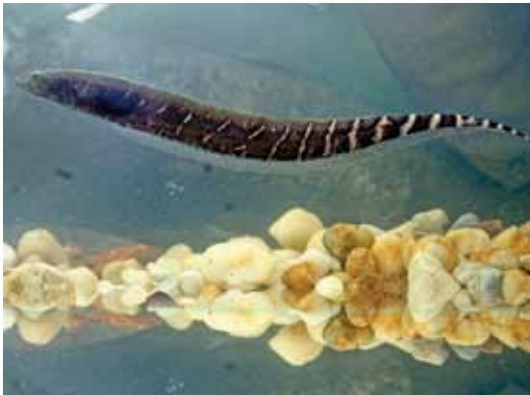
Gymnotus javari "macana"