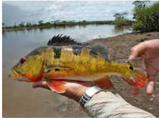
Cichla monoculus "tucunare"