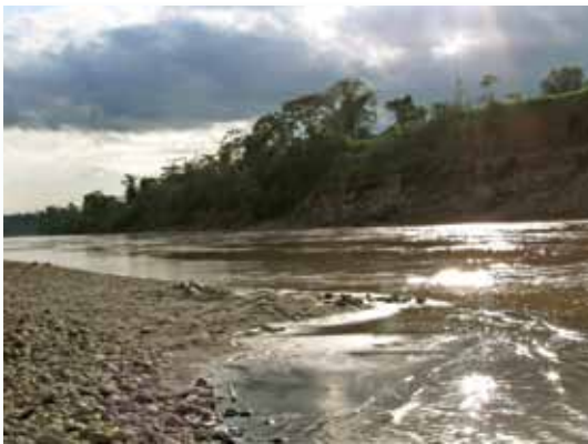
Río Pachitea, Puerto Inca Huánuco