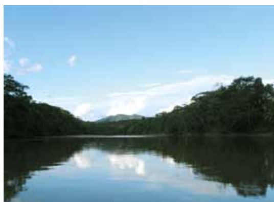
Río Palcazú, Pasco