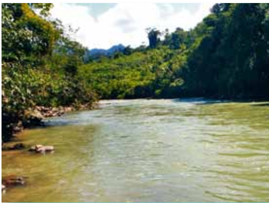
Río Abiseo, Parque Nacional Río Abiseo, cuenca del Huallaga