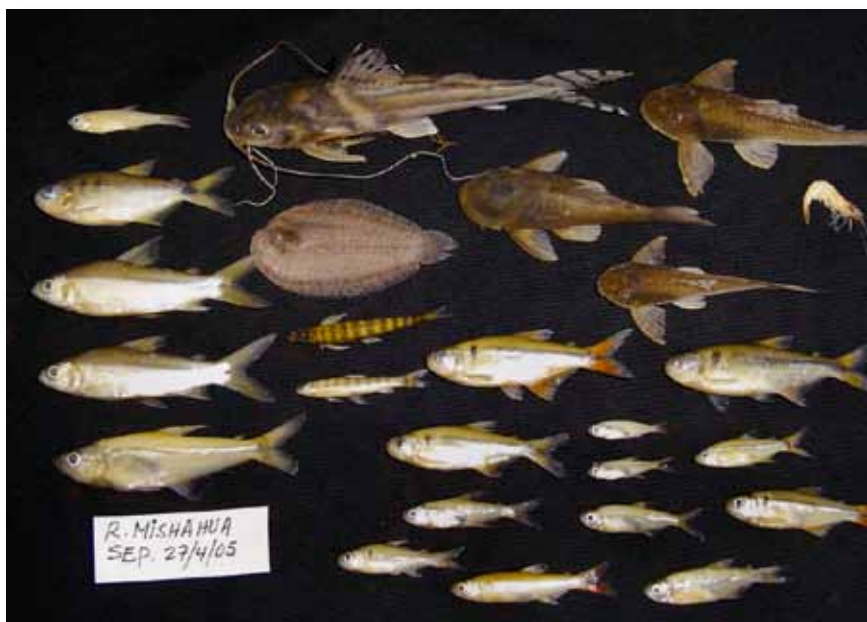
Muestra de peces del río Mishahua, Ucayali

Finalmente, otros órdenes que son formas de origen marino, como Clupeiformes (11 especies), Myliobatiformes (12), Pleuronectiformes (5), Beloniformes (5), y ocho órdenes más (12 especies en total) conforman juntos un 4% de la ictiofauna continental peruana (Tabla 1, P. 31).