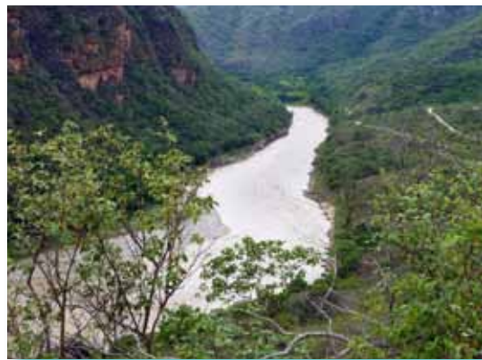
Río Marañón, entre Celendín-Cajamarca y Balsas-Amazonas