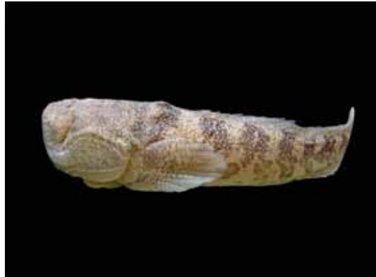
Thalassoprhyne amazonica "peje sapo"