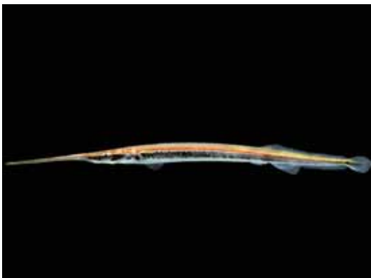
Potamorhaphis eigenmanni "pez aguja"