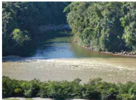
Río Aspirani y Araza, Cusco