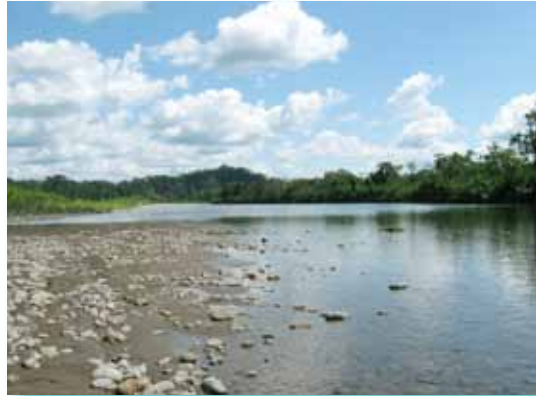
Río Cashiriari, Cusco