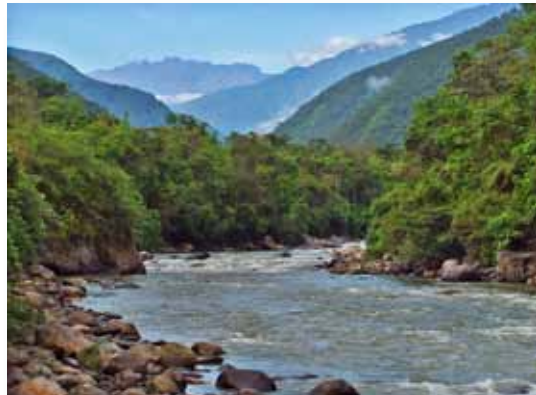
Río San Gabán, Puno