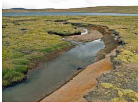
Laguna Tagraccocha, Huancavelica