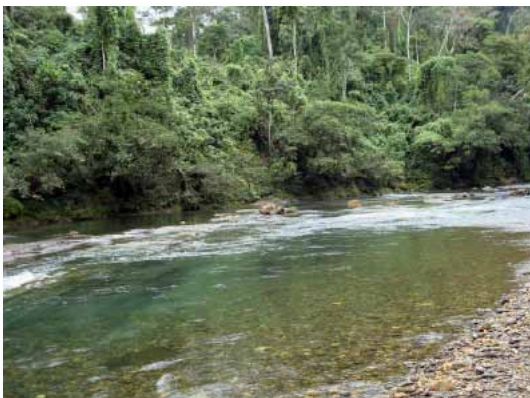
Río Jujununta, tributario del Araza, Cusco