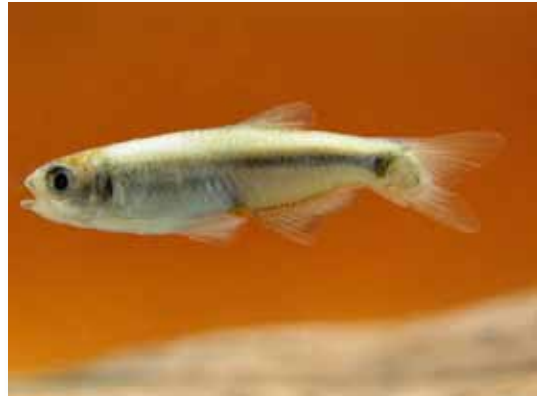
Tyttocharax sp. "mojarita"