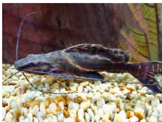
Leirius marmoratus "achara"