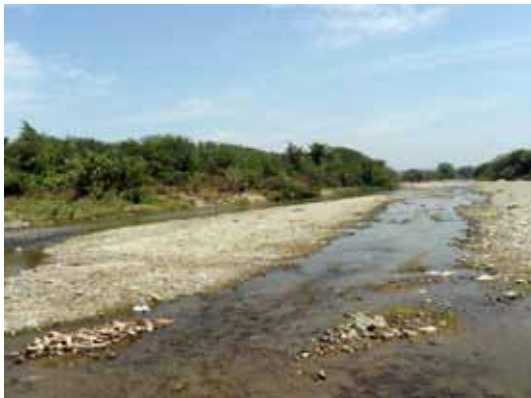
Río Tumbes, El Limón, Tumbes