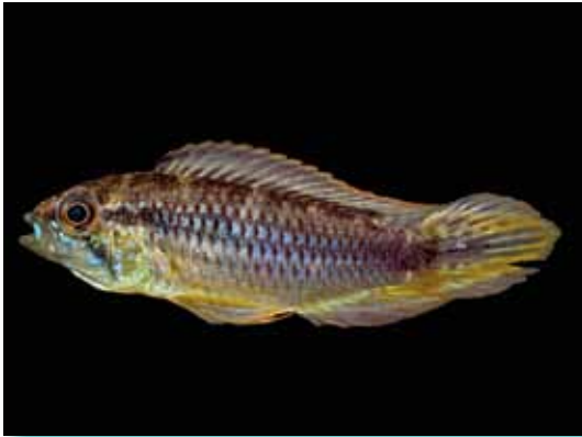
Apistogramma agassizi "bujurqui"