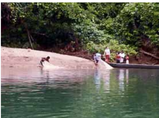
Pesca en el río Shihuaniro, Cusco