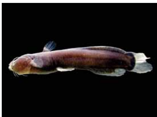
Myoglanis koepckei "bagrecito"