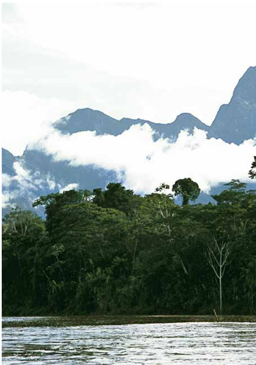
Río Pisqui, Mananshahuemana, Parque Nacional Cordillera Azul