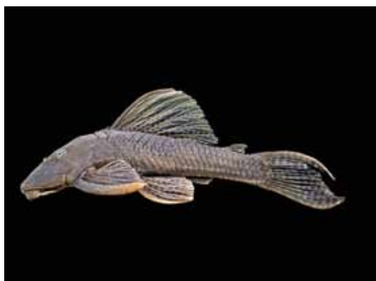
Hypostomus fonchii "carachama"