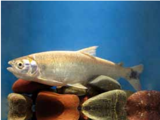
Brycon oligolepis "sabalo"