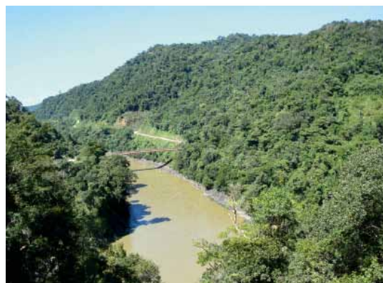
Río Inambari, cerca al Araza, Puno