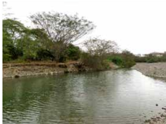
Río Tumbes, Brunos, Tumbes