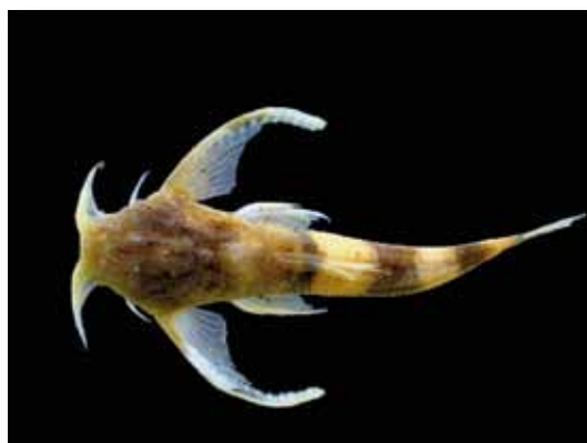
Ernstichthys megistus "bagrecito"