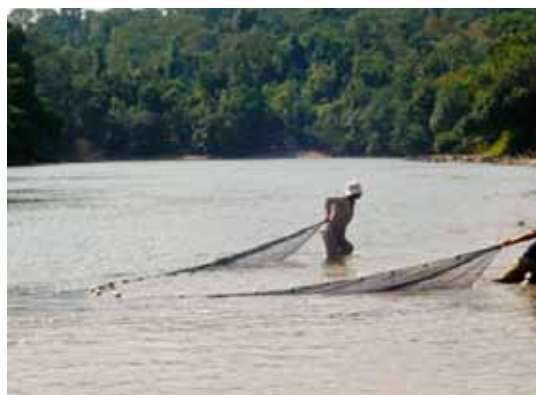
Pesca en el río Camisea, Cusco