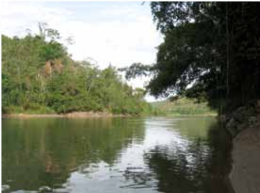
Río Perené, Junín