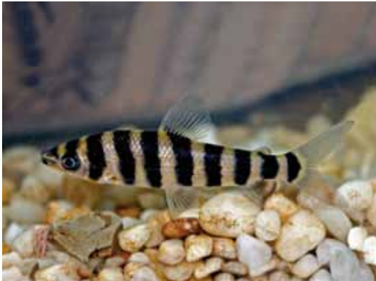
Leporinus fasciatus "lisa"