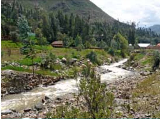
Quebrada Llancash, Ancash