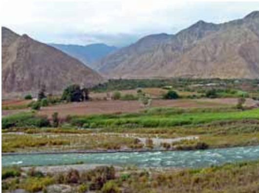
Río Cañete, Lima