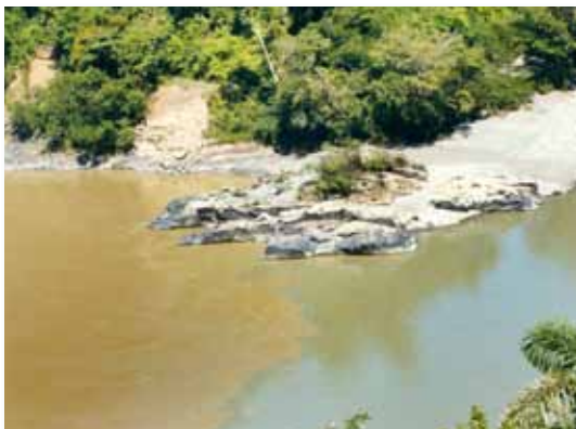
Río Araza e Inambari, Cusco - Madre de Dios