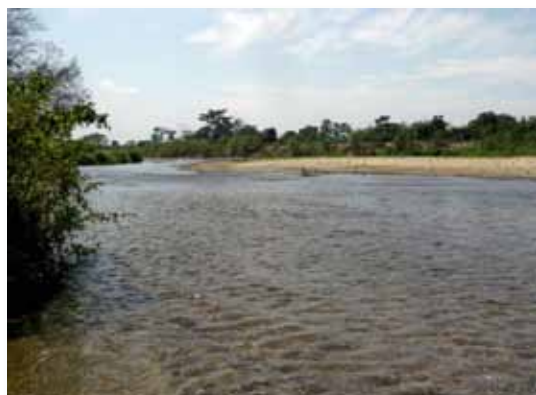
Río Tumbes, Tumbes