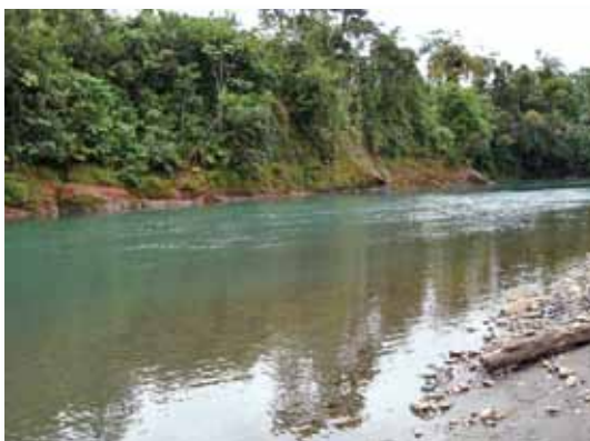
Río Yahuar mayo, tributario del Inambari, Puno