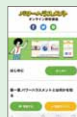
スマートフォン版