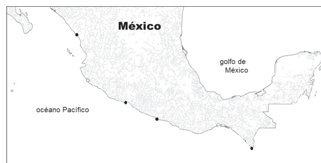
Figura 2. Mapa que indica los sitios donde se ha registrado a Dactyloscopus amnis (Perciformes: Dactyloscopidae) en México (puntos negros) y el nuevo registro (punto claro) para D. amnis en la cuenca del río San Nicolás, Jalisco. Datos para registros distintos al que se ubica para el río San Nicolás provenientes de Castro-Aguirre et al. (1999); Dawson (1975) y GBIF (2013).

disuelto (mg/l)= 5.49; conductividad eléctrica ( \mu S)= 272; temperatura ( ^{\circ} C)= 23.9 y salinidad (ppm)= 0.1. La fecha de colecta corresponde a la temporada de secas. El sitio de muestreo en el río San Nicolás presentó una anchura y profundidad promedio de 20 m y 0.4 m, respectivamente. El agua era generalmente clara, permitiendo ver claramente el fondo del río. El gasto en el río San Nicolás en fechas próximas a la recolecta (junio de 2013) fue de 0.03 m 3 /s. El individuo fue recolectado en la parte media del canal sobre un sustrato de arenas gruesas, en aguas con velocidad entre 0.0-0.3 m/s. Otras especies capturadas en ese mismo sitio fueron Awaous banana , Sicydium multipunctatum ,