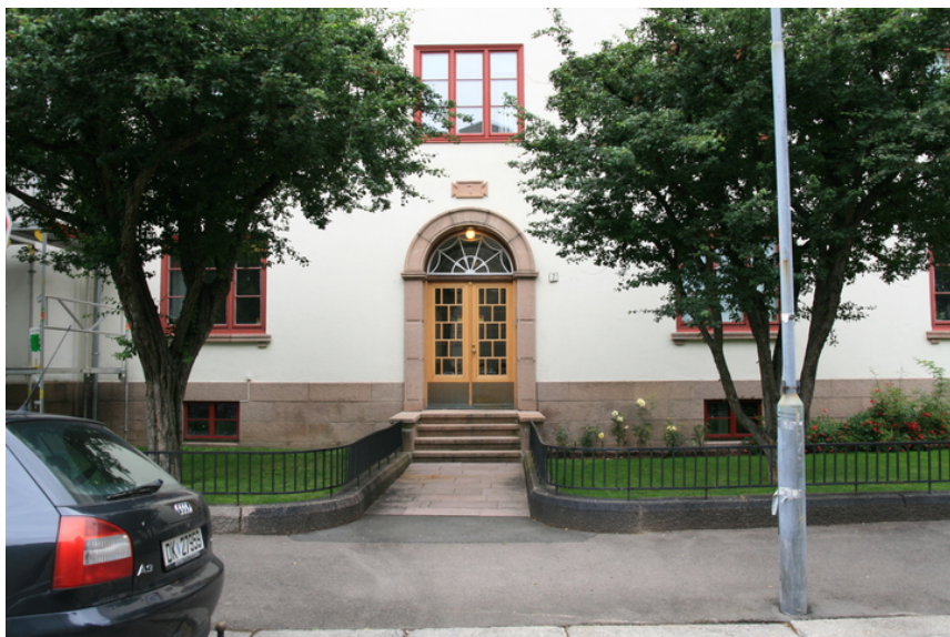
Detaljene i granitt rundt inngangsdøren er trolig spesialtegnet av arkitekten.