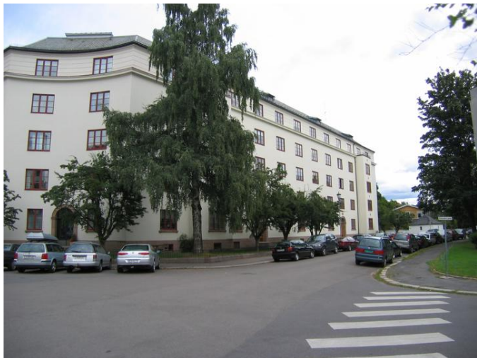
Fasade mot sør med inngangspartiene. I vest vender komplekset mot Fritzners gate.