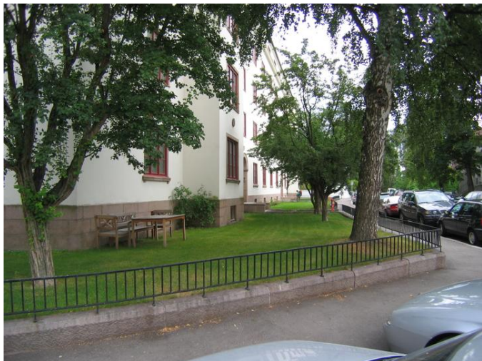
Foran gårdene er det små forhager som omkranses av et smijernsgjerde.