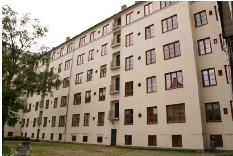
Fasaden mot bakgården som omkranser Frogner kirke.