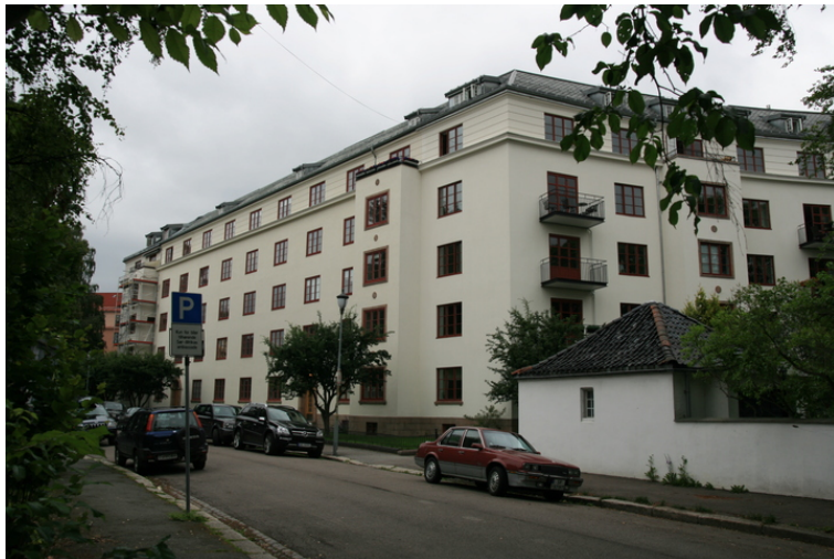
Fasade mot Gimle terrasse i sør.