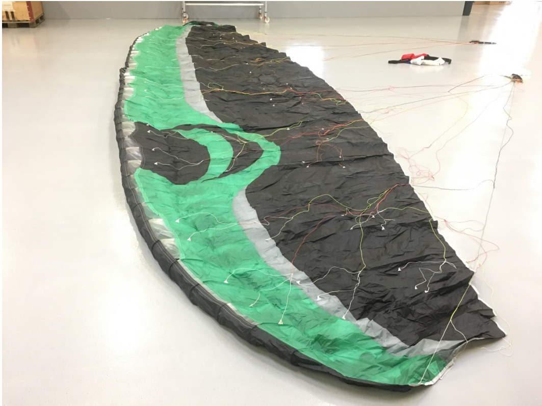
Abbildung 4: Ausgelegter Gleitschirm Gradient Golden4 22 der Pilotin.

Der Gleitschirm der Pilotin war in den Farben grün und schwarz gehalten. Die Pilotin führte ein Multifunktionsgerät vom Typ Flytec 6015 mit integriertem GPS-Empfänger mit, das unter anderem den Flugweg aufzeichnete. Ein Flarm-Modul 5 war nicht vorhanden.