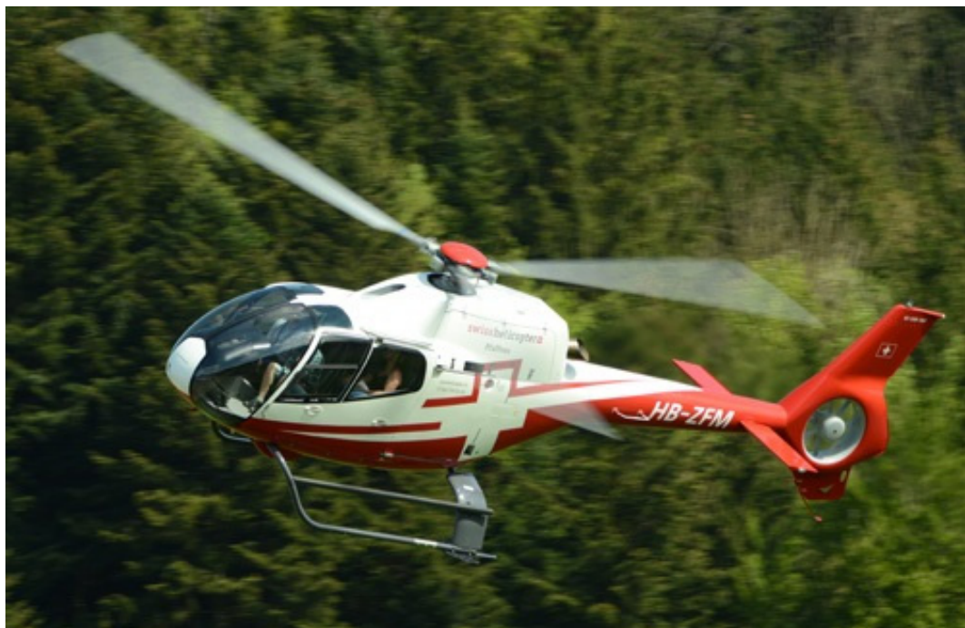
Abbildung 3: Helikopter EC 120 B, HB-ZFM

Beim Muster EC 120 B handelt es sich um einen einmotorigen, fünfsitzigen Mehrzweckhelikopter mit ummanteltem Heckrotor und Landegestell. Der Hauptrotordurchmesser beträgt 10.0 m. Die maximal zulässige Startmasse liegt bei 1715 kg.