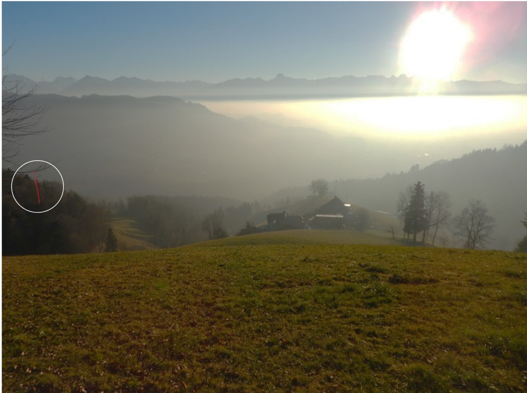
Abbildung 2: Blick vom Gleitschirm-Startplatz beim Guggel in südsüdwestlicher Richtung zum Bauernhof Glasholz; die Distanz zum Bauernhof beträgt knapp 250 m. Links im Bild ist das an einem Ast befestigte rote Band zur Indikation des Windes zu sehen (weisser Kreis). Der Weiler Barschwand befindet sich links der Waldkrete, die am linken Bildrand hinter dem roten Band zu sehen ist, und ist vom Startplatz aus nicht sichtbar. Die Aufnahme wurde am Folgetag kurz vor 16 Uhr gemacht.

beim ersten Flug in Richtung des Bauernhofs Glasholz. Dem Gleitschirm-Piloten, der sich noch am Startplatz befand und sich ebenfalls für den Start bereit machte, fiel auf, dass der Flug sehr flach vom Startplatz wegführte, also mit nur sehr geringem Sinken.