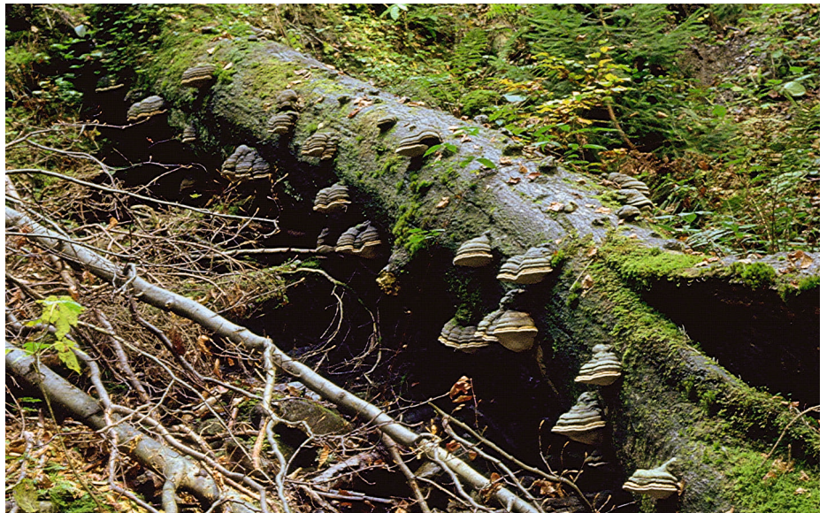
Stämme, Äste, Zweige, alle Sorten von Totholz, werden von Pilzen abgebaut. Konsolenpilze wie der Zunderschwamm ( Fomes fomentarius ) stehen oft stellvertretend für diese grosse Artenvielfalt.