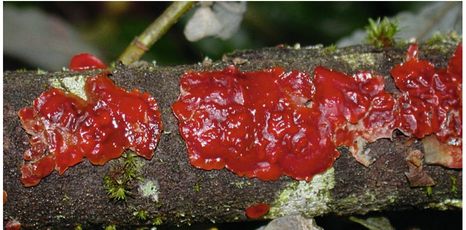
Der Blutrote Weiden-Lackpilz ( Cytidia salicina ) wächst ausschliesslich an Weiden – oft an alten und kränkelnden – bevorzugt an luftfeuchten Wald-, Bach- und Teichrändern.

Beim jetzigen Stand des Wissens lässt sich sagen, dass das Angebot von totem Fichten- und Buchenholz in der Schweiz von einer grossen Anzahl Pilzen genutzt wird. Für Pilze, welche diese beiden Holzarten abbauen, besteht ein grosses